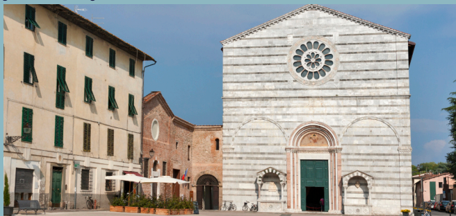
Chiesa di San Francesco

Proseguendo nel centro storico della città di Lucca, incontriamo uno dei suoi complessi monumentali più belli e prestigiosi, il Real Collegio , sede dell'antico convento della basilica di San Frediano e location della Cena di Gala , che avrà luogo la sera del primo giorno del convegno.