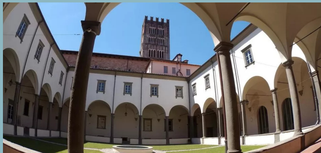
Chiostro Real Collegio COME ARRIVARE

In auto: Percorrere la A11 fino all'uscita Lucca Est. Una volta arrivati a Lucca continuare sulla SS12 radd/Viale Europa e successivamente sulla SS439 in direzione Via Elisa. Una volta entrati da Porta Elisa, percorrere Via dei Bacchettoni fino a Parcheggio Mazzini.